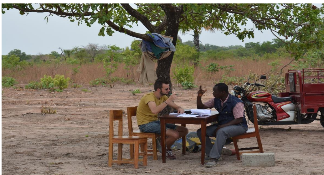
Foto 1 : Overleg van architect met aannemer bij aanvang bouw centre de ressource

Om tot een optimale werkomgeving te komen voor de equipe van het PIS project in de afgelegen regio Sinendé is besloten om een Centre de Ressource te bouwen dat tevens dienst doet als ontmoeting en trainingsplek voor de lokale bevolking. Het beheer van het centrum zal een samenwerkingsverband moeten worden tussen de lokale overheid, de georganiseerde bevolking en de ngo. Het centrum is opgetrokken uit stenen die ter plekke gemaakt zijn van lateriet (zgn. terre stabilisée) waarbij zo veel mogelijk met lokale krachten gewerkt is. De start van de bouw in april 2017 vond plaats in aanwezigheid van de voorzitter van Marèjan en de architect van het gebouw (foto 1).